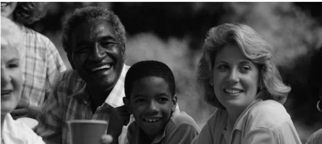
Tomando un descanso